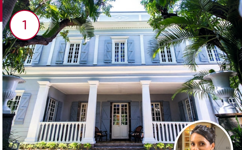
LA VILLA RIVIÈRE