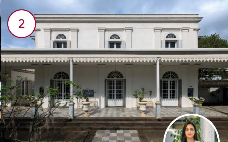
LA VILLA REPIQUET