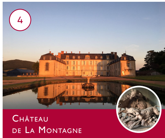
CHÂTEAU DE LA MONTAGNE