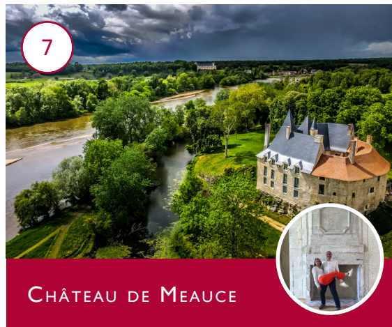
CHÂTEAU DE MEAUCE