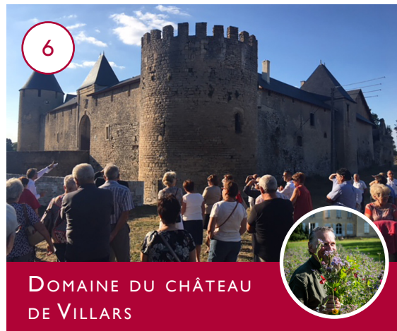
DOMAINE DU CHÂTEAU DE VILLARS