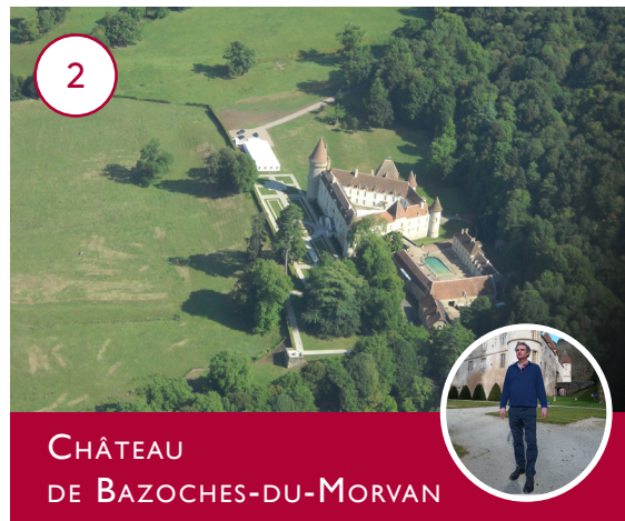
CHÂTEAU DE BAZOCHES-DU-MORVAN