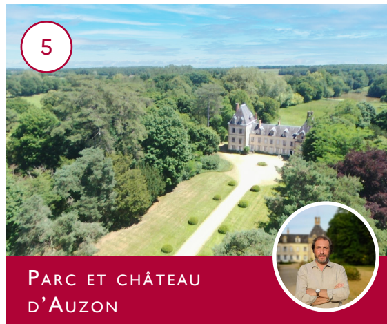
PARC ET CHÂTEAU D'AUZON