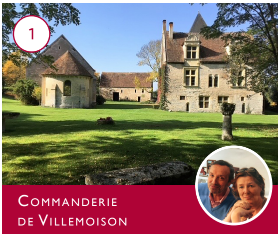
COMMANDERIE DE VILLEMORIS