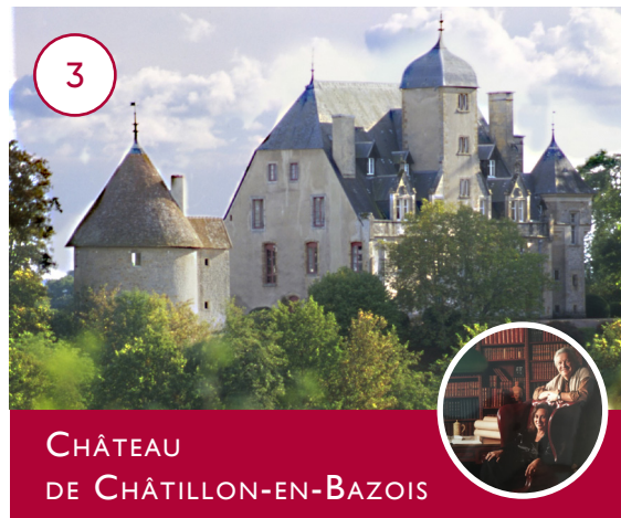
CHÂTEAU DE CHÂTILLON-EN-BAZOIS